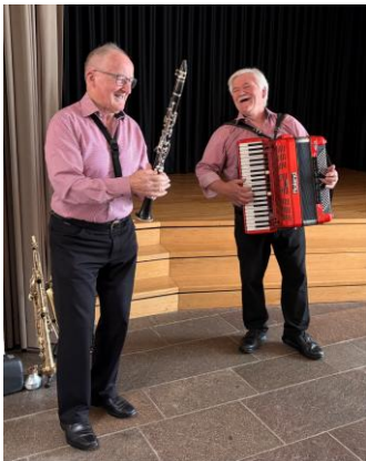
Am 65+ -Nachmittag vom 23. April sorgten die Swissboys für beste Stimmung im Saal.

Reformierte Kirche Staufberg Staufen Schafisheim