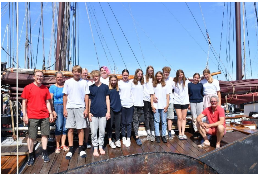
Text und Bild: Martin Domann, Ref. Kirche Lenzburg-Hendschiken

Es war eine herrliche Reise, die vom 29. Juli bis zum 05. August dauerte, die schliesslich mit einem Besuch in Amsterdam abgerundet wurde.